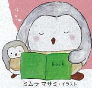
ミムラ マサミ・イラスト