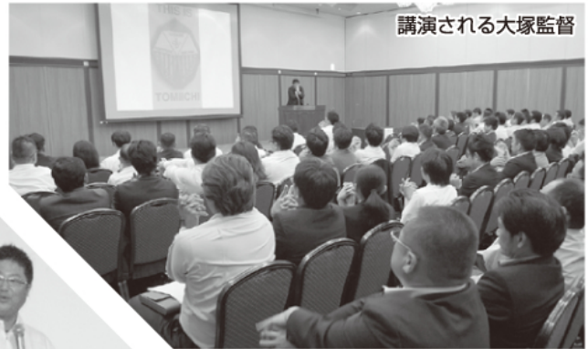
講演される大塚監督