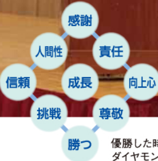
優勝した時の ダイヤモンドナイン

チームでは毎年春に行動指針ともいえる「ダイヤモンドナイン」を選手たちに決めさせる。