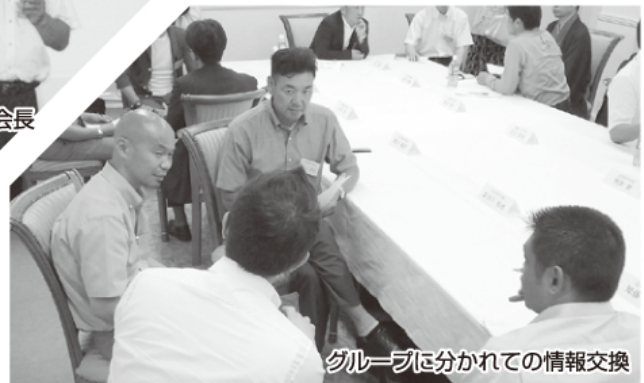
グループに分かれての情報交換